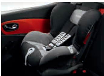
KINDERSITZ 77 11 423 381