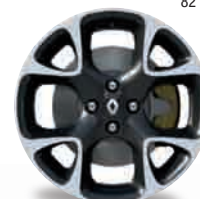
17-ZOLL-FELGE KOURANOS 82 01 335 578