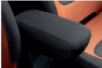
MITTELARMLEHNE 82 01 367 091