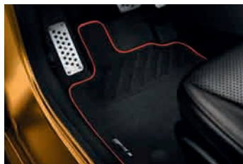
TEPPICH R.S. 82 01 370 537