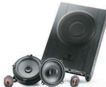
FOCAL MUSIC PREMIUM 77 11 575 882