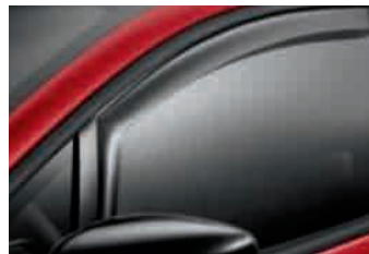
WINDABWEISER 77 11 574 780