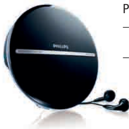
CD-PLAYER 77 01 369 118