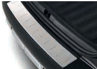
LADEKANTENSCHUTZ 82 01 450 086