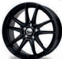
16-ZOLL-FELGE RC22, IN SCHWARZ MATT SCHWARZ GLANZ VOLL-POLIERT 77 01 369 086 SCHWARZ MATT 77 01 377 394