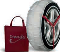
SCHNEESOCKE Trendy 38

FÜR 15-ZOLL 77 11 238 225 FÜR 16- UND 17-ZOLL 77 11 238 226