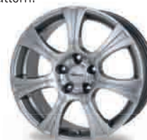
16-ZOLL-FELGE HELIOS CHROMSILBER 77 01 376 040