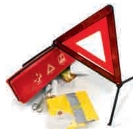
SICHERHEITSKIT 77 11 425 749