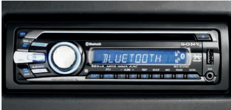
EINBAURAHMEN 82 01 321 505