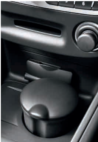
RAUCHER-KIT 82 01 375 535