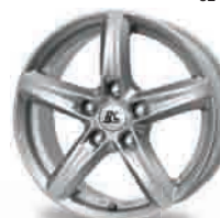
RC24 KRISTALLSILBER 77 01 369 621