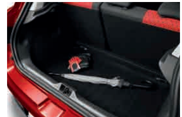
KOFFERRAUMSCHALE 5-TÜRER: 82 01 321 361 – GRANDTOUR: 82 01 321 362