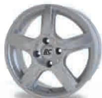
15-ZOLL-FELGE RCD10 KRISTALLSILBER 77 01 369 231