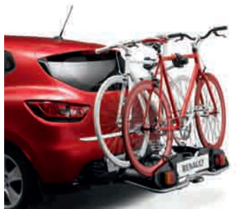
FAHRRADTRÄGER THULE EURORIDE 77 11 430 094