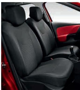
SITZBEZÜGE SITZBEZUG VORDERSITZE 82 01 372 470 SITZBEZUG RÜCKSITZBANK 82 01 321 312