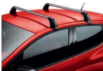
DACHTRÄGER 82 01 321 618