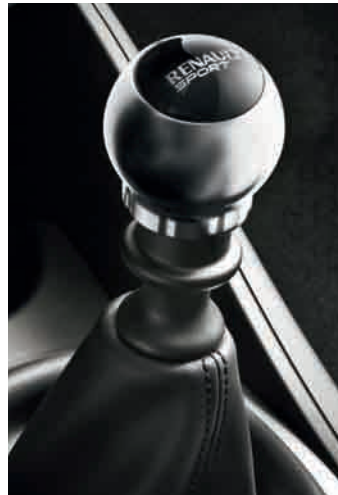
SPORTSCHALTKNAUF 82 01 300 589