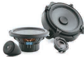
LAUTSPRECHER FOCAL MUSIC LIVE 77 11 575 881