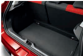
KOFFERRAUMTEPPICH 5-TÜRER: 82 01 321 290 – GRANDTOUR: 82 01 321 291