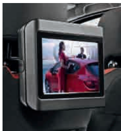
VIDEOSYSTEM 77 11 430 555