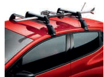
SKITRÄGER 77 11 420 778