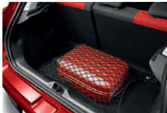
KOFFERRAUMNETZ AM BODEN 77 11 227 501