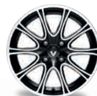
15-ZOLL-FELGE KANJARA 82 01 468 869