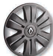
SICHERHEITSRADZIERBLLENDE FREGATE 15" 82 01 359 230