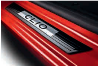
EINSTIEGSLEISTEN 82 01 391 423