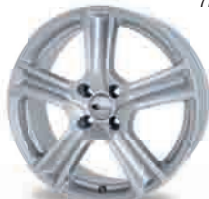
16-ZOLL-FELGE RC19 KRISTALLSILBER 77 01 369 376