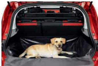
TRENNGITTER 5-TÜRER: 82 01 321 369 – GRANDTOUR: 82 01 321 370