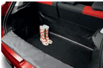
TEMPORÄRE KOFFERRAUMSCHUTZMATTE 5-TÜRER: 82 01 361 213 – GRANDTOUR: 82 01 361 214