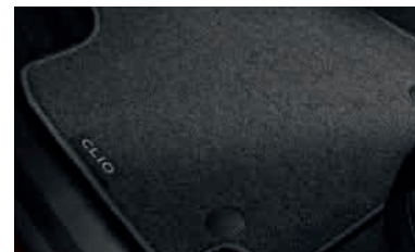
CONFORT 82 01 321 301