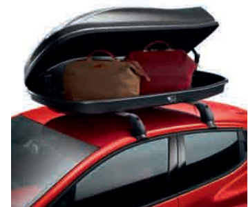
DACHKOFFER 77 11 575 524