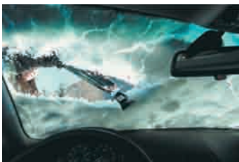
STANDHEIZUNG WEBASTO THERMO TOP EVO 4 BENZIN/DIESEL: 77 01 378 122/77 01 378 123 EINBAUKIT CLIO IV: 77 01 369 405