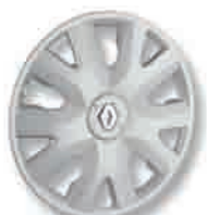
SICHERHEITSRADZIERBLLENDE GRADIENT 15" 82 01 392 441