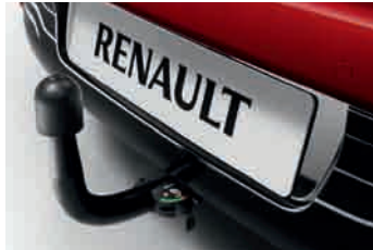
ABNEHMBAR 5-TÜRER 82 01 367 605 82 01 367 607