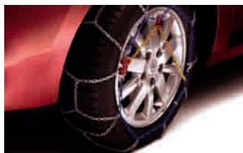
SCHNEEKETTEN Ideal 9 mm

GRUPPE 7 77 11 573 117 GRUPPE 8 77 11 573 118