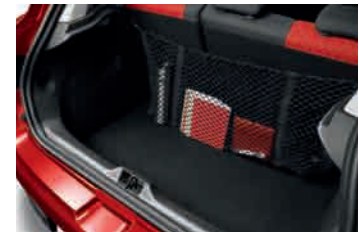
VERTIKALES AUFBEWAHRUNGSNETZ 77 11 227 502