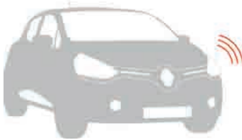
ALARMANLAGE 82 01 275 125