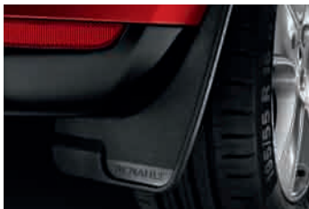
UNIVERSAL-SCHMUTZFÄNGER FÜR VORNE ODER HINTEN 82 01 212 479