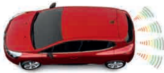
EINPARKHILFE VORNE: 77 11 238 161 HINTEN: 82 01 373 014