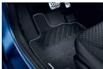
TEPPICH GT 82 01 339 989